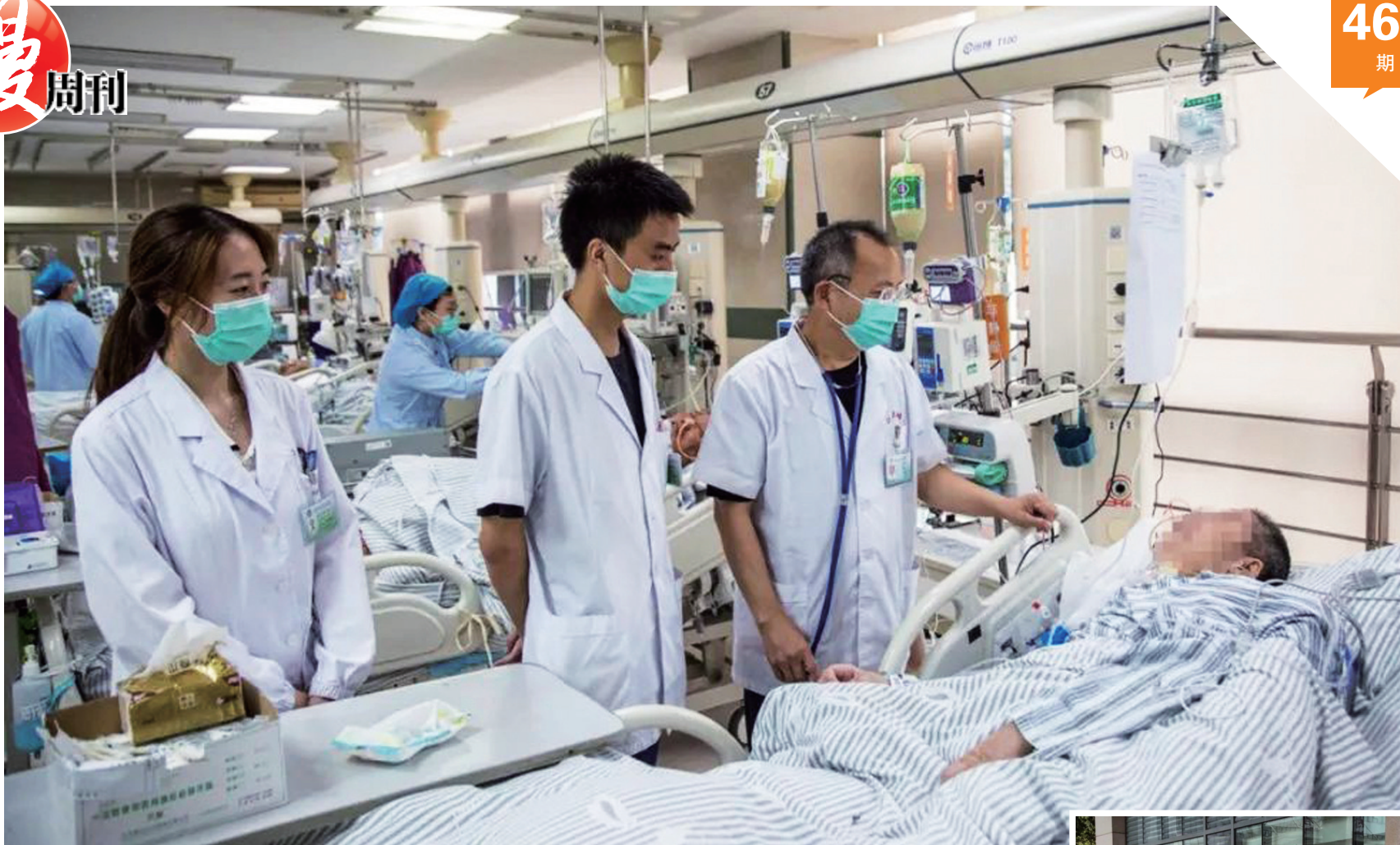
经过救治，患者转危为安。